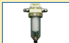
Feinstaubfilter mit Filterhülse