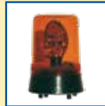
Drehspiegelleuchte (auch als EX-Version erhältlich)