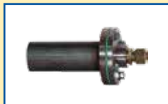
Montagestutzen mit Einfachflansch