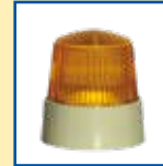
Blitzpulser (auch als EX-Version erhältlich)