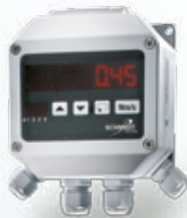
LED-Messwertanzeige MD 10.010/10.015

Vor allem bei der Personensicherheit und der Qualitätssicherung kommt Ihnen hierbei unser hoher Qualitätsanspruch zugute. Natürlich ist jeder Sensor mit einem ISO-Kalibrierzertifikat lieferbar, auf dem die Genauigkeit schwarz auf weiß dokumentiert ist.