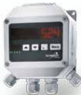
LED-Messwertanzeige MD 10.010/10.015

Strömungssensoren von SCHMIDT Technology helfen Ihnen dabei, maximale Energieeffizienz zu erreichen, Messwerte unter Kontrolle zu behalten und dauerhaft für optimalen Betrieb zu sorgen. Hilfreich ist auch der einfache und schnelle Einbau der Sensoren am Kanal: Loch bohren, Sensor mittels Montage-Flansch befestigen, elektrisch anschließen – fertig.